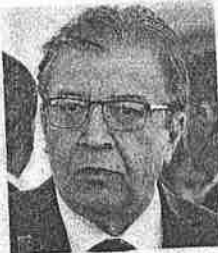
Nicanor Duarte Frutos, director paraguayo de Yacyretá. Ya autorizó casi G. 500 millones para el Escolta Presidencial.

Cuando el vicepresidente Hugo Velázquez visitó Mi-