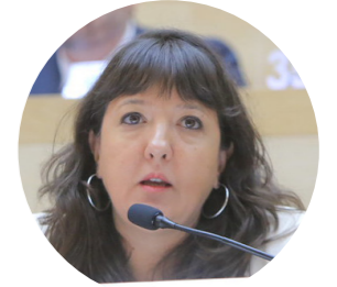
Marina Femenía Parlamentaria de la Delegación de Argentina

Estamos viviendo un cambio de época que no tiene precedentes. No se trata simplemente de que la tecnología avance, sino de cómo esa tecnología está reconfigurando las bases de nuestra convivencia, nuestra identidad y nuestras democracias. En la reciente sesión de abril del Parlamento del MERCOSUR, hemos dado un paso histórico al aprobar tres proyectos de mi autoría que, lejos de ser meros ajustes técnicos, constituyen un manifiesto por la soberanía regional en la Era Digital.